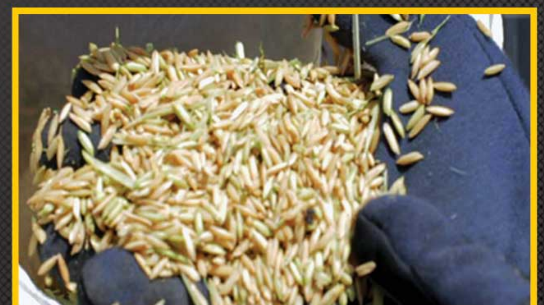
Hasil gabah yang bersih dari kotoran

Melalui Double Drum, Kebersihan gabah yang dihasilkan dan total bulir padi yang masuk ke karung melalui proses perontokan dalam mesin akan meningkat sampai 99%, karena pada mesin drum kedua terdapat blower penghisap yang akan memisahkan setiap kotoran yang masuk bersamaan dengan bulir padi. Kebersihan gabah ini akan meningkatkan harga gabah perkarungannya, serta akan membantu proses pengeringan (Dryer) menjadi lebih cepat dan tidak akan merusak mesin pengeringan, karena adanya kotoran lahan yang ikut terbawa bersama gabah.