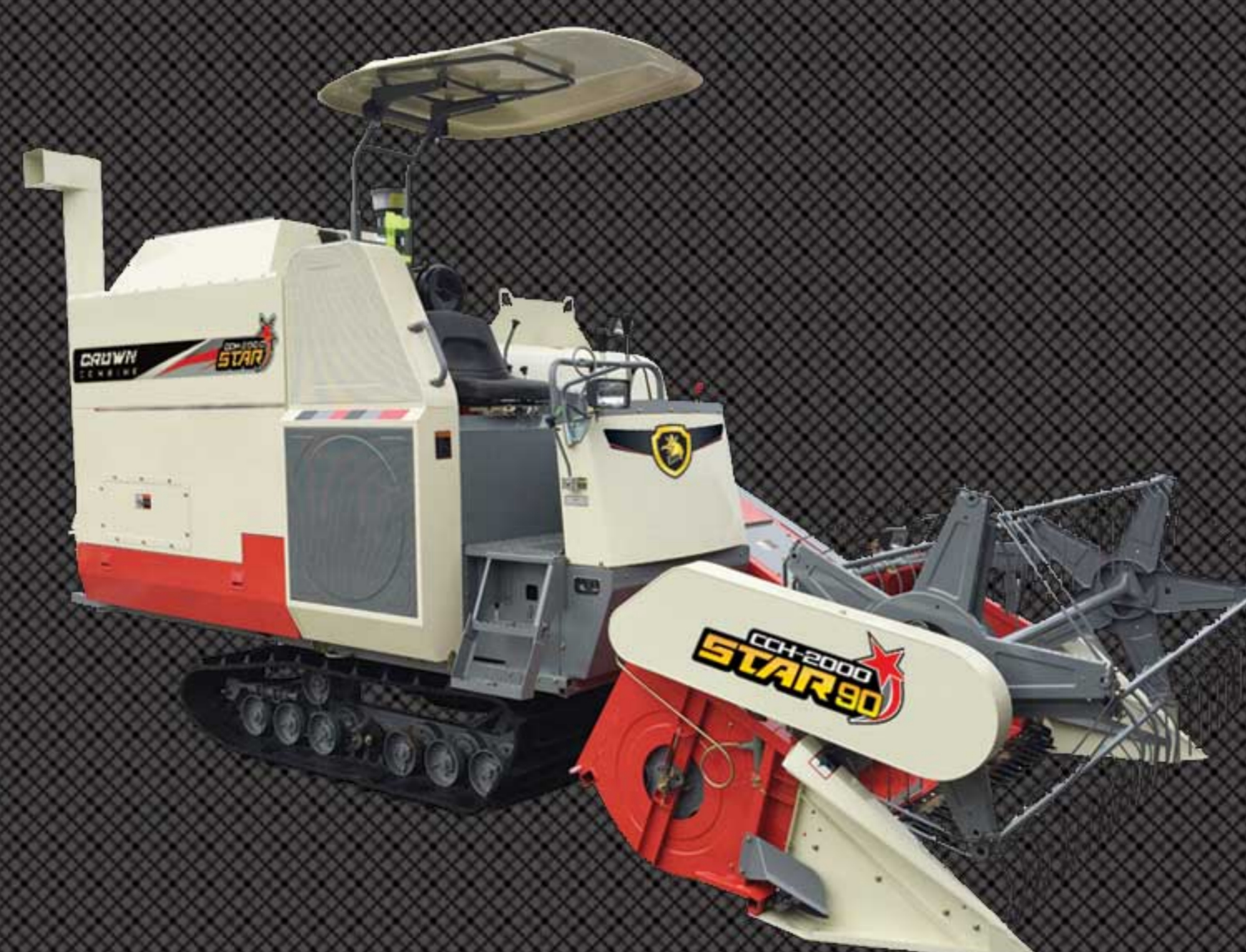
TANGKI 500 kg AUGER STANDART (II)