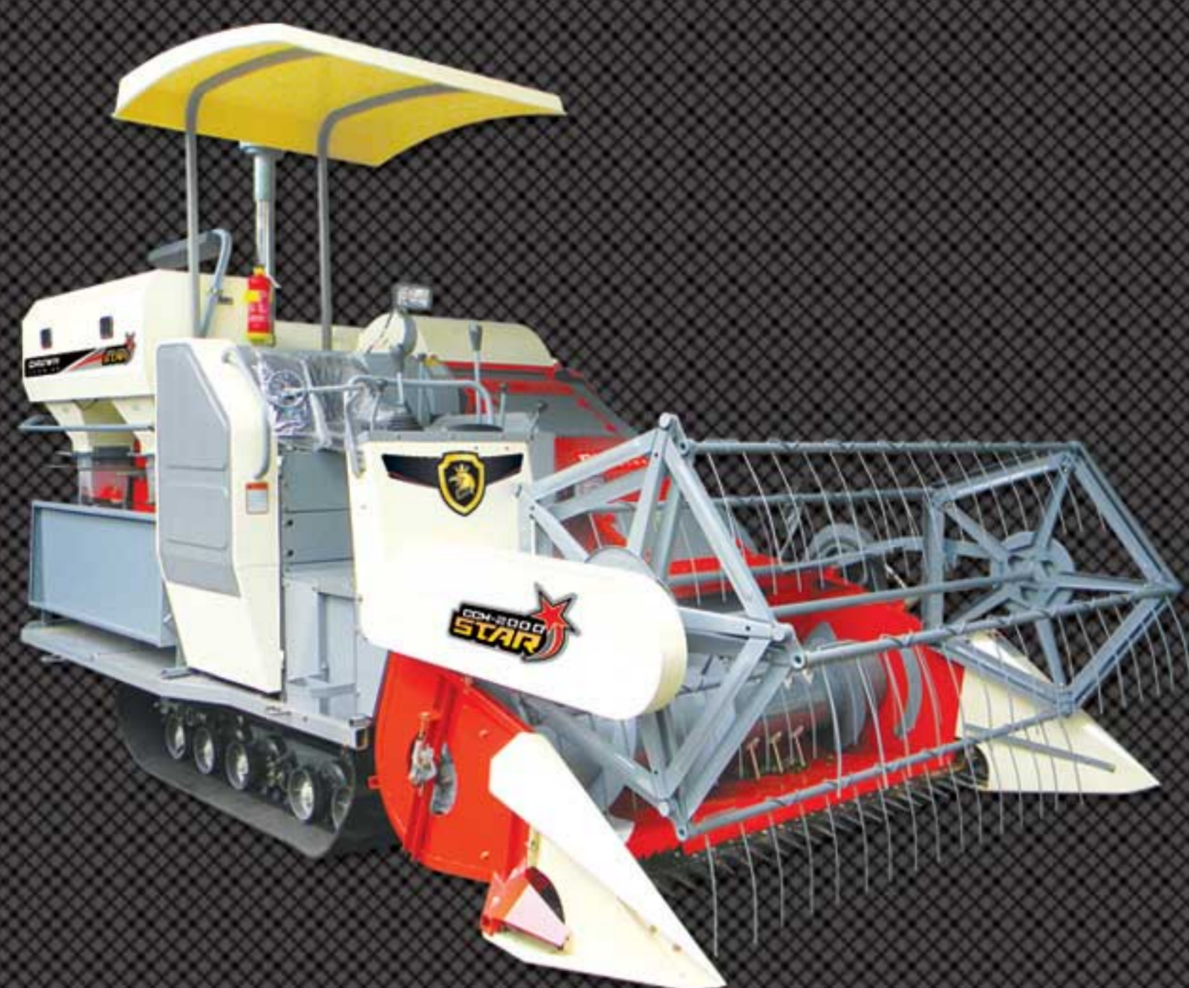
TANGKI 250 kg HOPPER MANUAL (I)