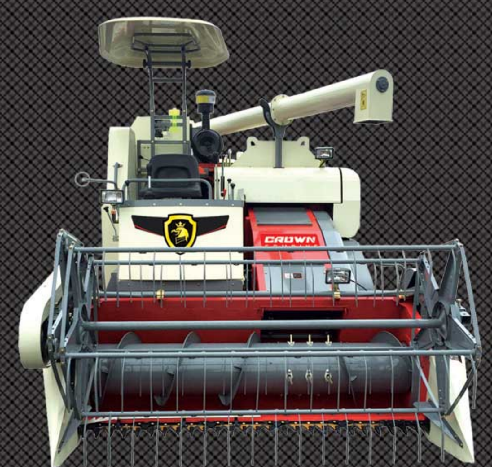
TANGKI 800 kg AUGER SWING 360° (III) *Khusus CCH-2200 STAR ELITE