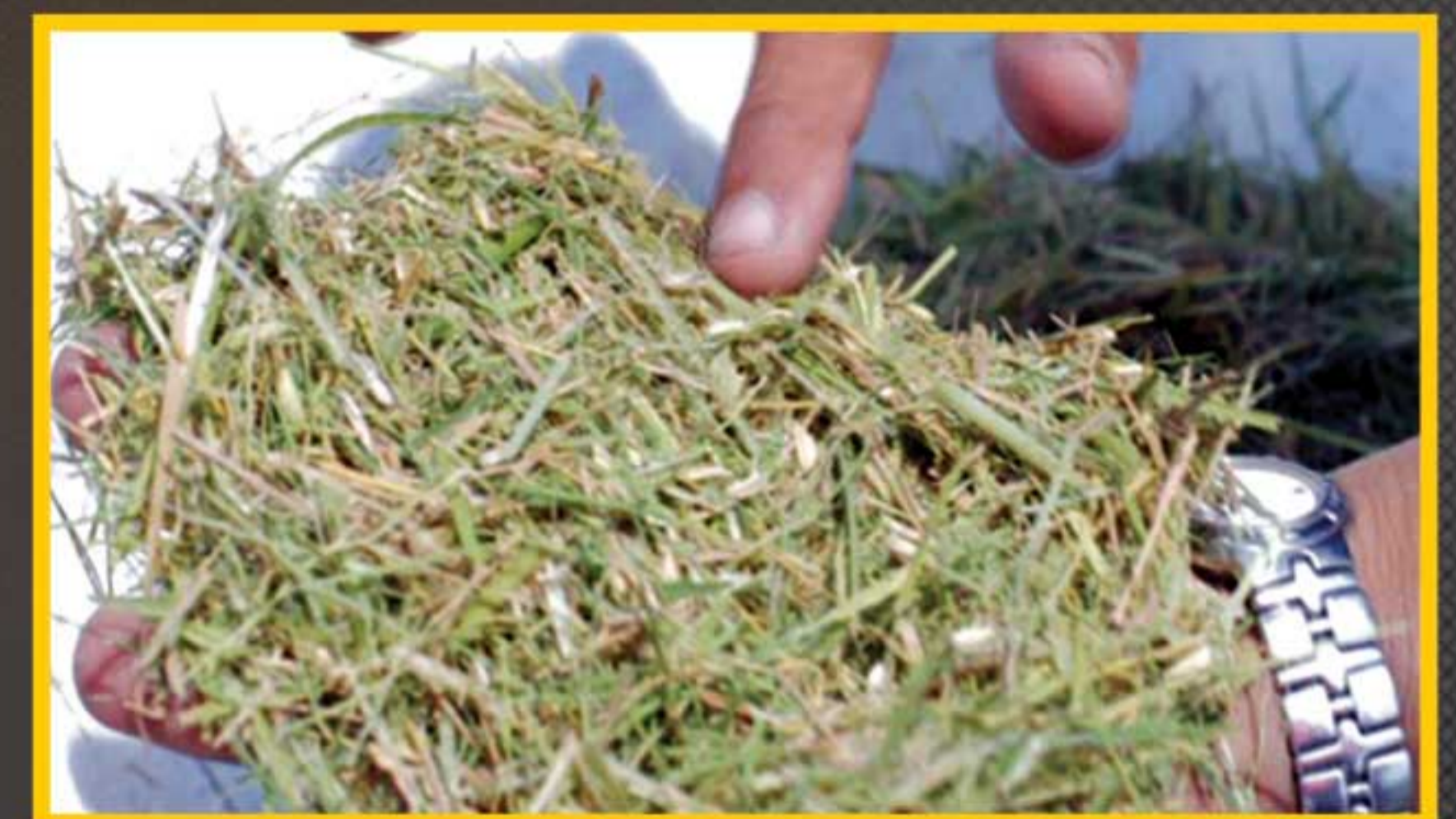
Meminimalisir kehilangan gabah